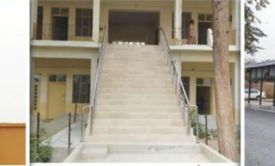
ڈی سی کپٹیکس میں تعمیر ہونے والی نئی سڑکیوں کا ایک منظر۔