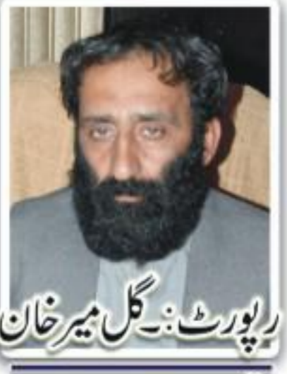
رپورٹ: گل میر خان