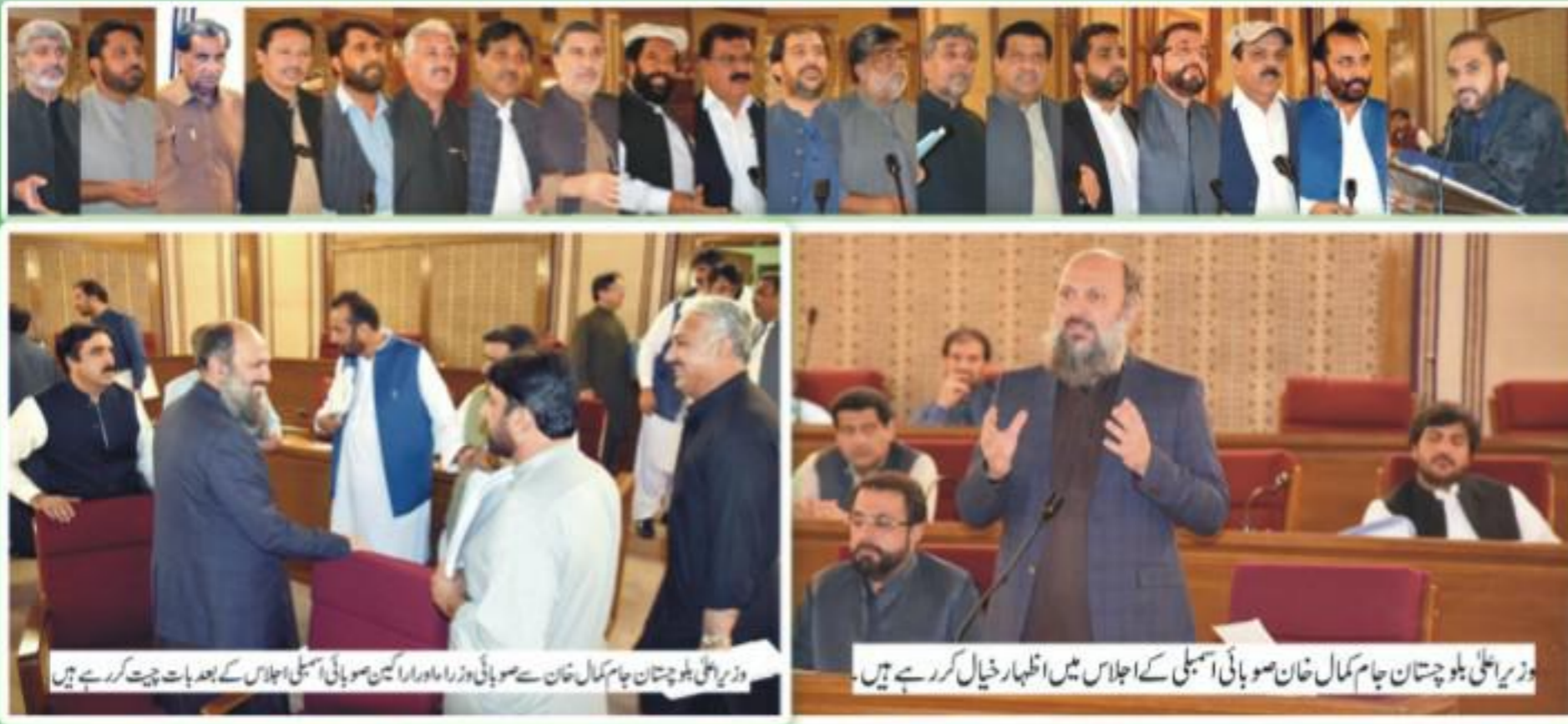
وزیر اعلیٰ بلوچستان جام کمال خان صوبائی اسمبلی کے اجلاس میں اظہار خیال کر رہے ہیں۔