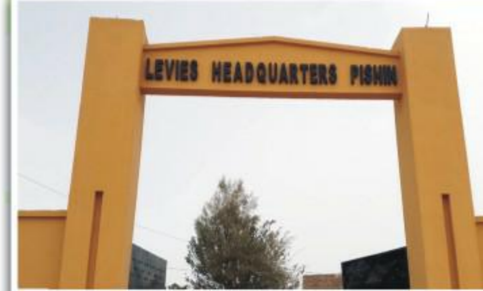
لیو پورس کوآرڈری مین دیواروں کی پختگی کے بعد کی خوبصورت فوٹو۔