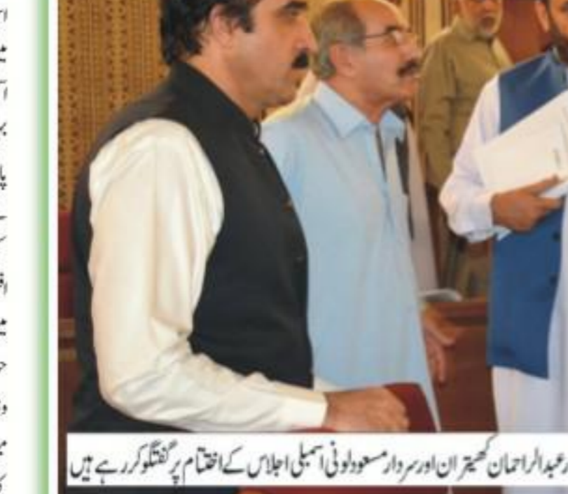
وزیر اعلیٰ بلوچستان جام کمال خان سے صوبائی وزراء اور وفاقی وزیر اور سردار عبدالرحمان کھٹیران اور سردار مسوولونی اسمبلی اجلاس کے اختتام پر گفتگو کر رہے ہیں

صوبائی کابینہ کے اجلاس میں فیصلہ کیا گیا ہے اس سلسلے میں مربوط اور موثر اقدامات اٹھائے جائیں، اور اس سلسلے میں نظر ثانی کی درخواست جمع کرانے سمیت دیگر آفسز پر بھی غور کر رہے ہیں انہوں نے کہا کہ ریکورڈ منسوبے سے متعلق اراکین اسمبلی کو ان کیسز بریفنگ دینے کے لئے تیار ہیں انہوں نے کہا کہ سعودی آئل ریٹائنری سے متعلق فیصلہ صوبائی حکومت کرے گی صوبے میں لینڈ لیز ایک منظور ہوئی جس کے تحت بیرون ممالک سے آئیٹا لے سرائے کار میں خرید نہیں سکتے انہیں حکومت سے زمین کر لیں پر لینڈ ہوگی پہلی مرتبہ صوبے میں شفافیت اور انصاف کے عمل کو بہتر بنایا گیا ہے ٹرانسفر پوسٹنگ حکموں میں بہتری کے لئے معمول کے مطابق کی جاتی ہیں۔ انہوں نے کہا کہ پیپلز کونسل ڈیولپمنٹ اتھارٹی کے قیام سے متعلق آئینی ترمیم کی ضرورت ہے جو سیاسی جماعتوں کو اعتماد میں لے لے بغیر ممکن نہیں ہے۔ اجلاس میں صوبائی وزیر سردار عبدالرحمان کھٹیران نے اسپیکر بلوچستان اسمبلی کی قیادت میں جائیداد و نقد کو کامیاب دور سے پر مبارکباد دیتے ہوئے کہا ہے کہ وفد نے کانفرنس میں متدل