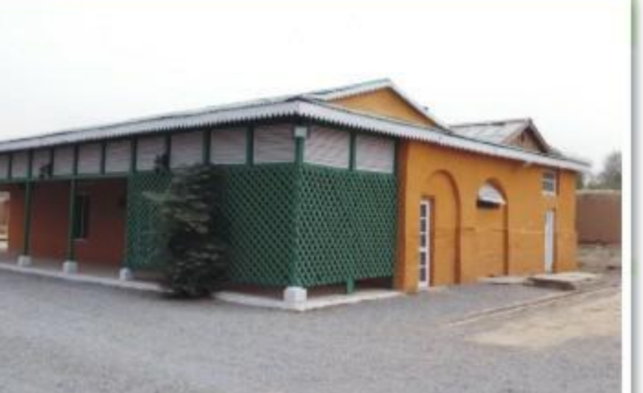
ڈپٹی کمشنر کی کوششوں سے قائم کیا جانے والا آفیسرز کلب کی ایک خوبصورت تصویر۔